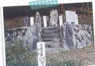
①唐茶待ちの石 - 朝鮮の名人 -

1598年、加藤清正が朝鮮からつれて帰った唐茶の名人慶喜をこの地、川原谷へ派遣した。村人が導出で、一行を出迎えた所といわれる。