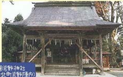
⑨岩野神社 (鹿北町岩野町内)

さらに三号線を横断して川べりの小径を3分程歩くと大木に囲まれ、ひっそりと歴史を刻んだ岩野神社にたどり着く。1622年、再建。日露、日清戦争の従軍記念碑がある。