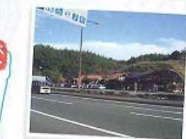
⑪道の駅かまくら (茶の展示室)

年間を通して利用できるロッジ10棟(シャワー・トイレ・冷暖房完備)テントサイトは7月~9月末のご利用となっております。またシャクナゲ・遊歩道・野山に咲く三つ葉ツツジがきれいです。11月紅葉がきれいになります。