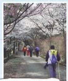
岳間深谷ぐつとウオーク