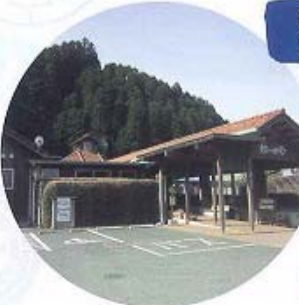
⑭鹿北茶聖祥の地 (皇居区)

標高1018m茂田井登山口より約一時間で登れます。登山口まで岳間深谷キャンプ場より4km、5月に山開きが行われます。