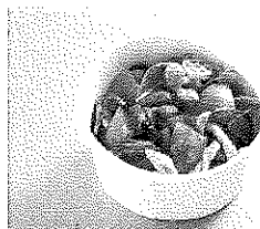
(山都町：清和物産館UD弁当)