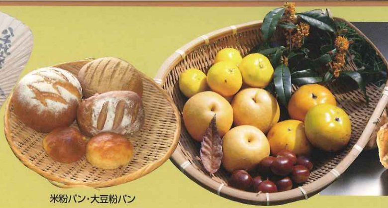
米粉パン・大豆粉パン