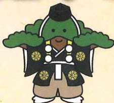
八千代座イメージキャラクター 「チヨマツ」