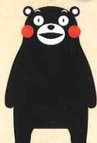
熊本県営業部長 「くまモン」