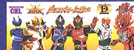
ローカルヒーローコラボショー ①午後6時30分～ ②午後8時～