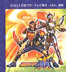
仮面ライダーガイムショー ①午後6時～ ②午後8時～