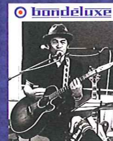
BON DX 午後9時～