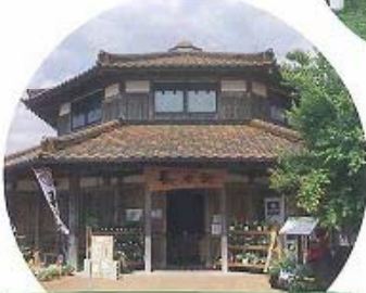
②動物園物産館「長者館」 歴史公園動物園にある物産館。米原地区に伝わる「長者伝説」にちなんで命名。

1300年前の大和朝廷時代に建造された古代山城跡(国史跡)。貴重な出土品も多く、八角形鼓棟や米倉、板倉などが復元されている。マスコットキャラクター「ころろ君」も人気。