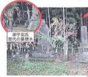
御宇田氏歴代の豊穰木

①御宇田氏歴代の豊穰木 御宇田氏は当地における開拓の大黒人である。内田川の水を引入れて豊産となし、さらにその水を利用して水田を開いた御宇田をはじめ系民地方一帯は開拓され現代に及んでいます。