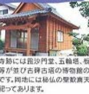
⑯長福寺跡と古碑古塔

寺跡には毘沙門堂、五輪塔、板碑等が並び古碑古塔の博物館の様です。同地には秘仏の聖観音天も祀っています。