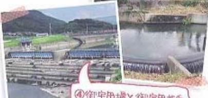
④御宇田井手と御宇田井手

925年御宇田城主の御宇田氏が内田川の水を引いて作ったもので熊本県下の井手のほとんどが加藤清正以降の開削であるのに比べこの御宇田井手が熊本県下で最も古い伝統をもつ用水です。