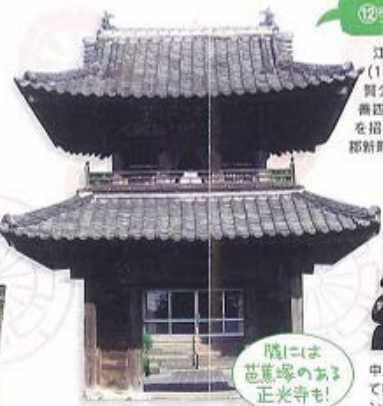
⑫室唇絵図のある大光寺

925年御宇田城主の御宇田氏が内田川の水を引いて作ったもので熊本県下の井手のほとんどが加藤清正以降の開削であるのに比べこの御宇田井手が熊本県下で最も古い伝統をもつ用水です。