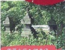
③平安時代の水堀跡

①御宇田氏歴代の豊穰木 御宇田氏は当地における開拓の大黒人である。内田川の水を引入れて豊産となし、さらにその水を利用して水田を開いた御宇田をはじめ系民地方一帯は開拓され現代に及んでいます。