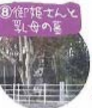
⑧御宇田さんと乳母の墓